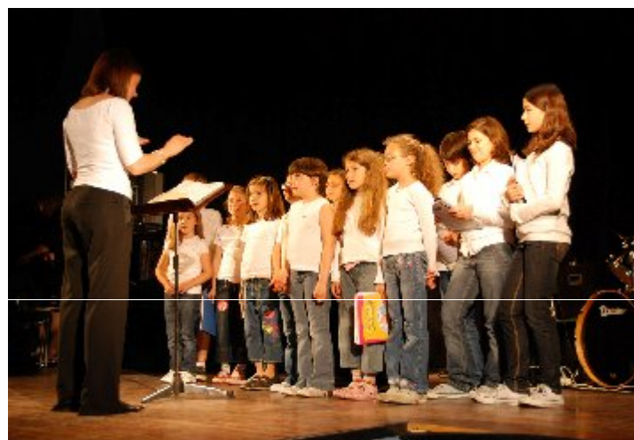
nella foto il Coro dei Bambini durante il saggio di fine anno

Le vacanze sono ormai alle spalle e siamo giunti alla ripresa delle consuete attività autunnali. Il Centro Musica in Lemine riapre le porte della Scuola di Musica ricca anche quest'anno di idee ed attività. Pianoforte, chitarra, violino, viola, arpa celtica, flauto, clarinetto, canto lirico ed inoltre batteria, chitarra elettrica, basso elettrico, canto moderno sono le discipline più richieste, ma non dimentichiamo le attività a latere che creano entusiasmo ed affiatamento: musica d'insieme, l'orchestra dei nostri piccoli strumentisti, il coro per bambini ed adulti, yoga e Feldenkrais, ed i corsi propedeutici per i più piccoli. I percorsi di studio spaziano da quelli più strutturati per bambini e ragazzi, con un possibile futuro nel mondo della musica, a quelli amatoriali per chi, magari non più giovanissimo, desidera affrontare un cammino personalizzato nella tranquillità e nel divertimento. Ricordiamo che l'indirizzo del nostro sito è: www.musicainlemine.com e che le nostre porte sono aperte per chi ci vuole venire a trovare e conoscere in via S. Rocco al numero 5.